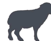
CARN DE L'ESPÈCIE OVINA I CAPRINA